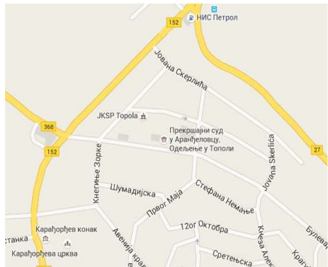
Zgrada u kojoj je smešteno Odeljenje u Topoli