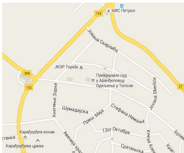
Zgrada u kojoj je smešteno Odeljenje u Topoli