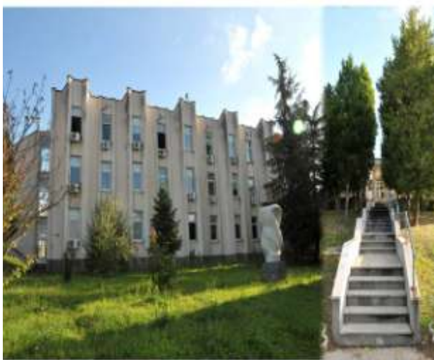
Зграда у којој је смештено седиште суда