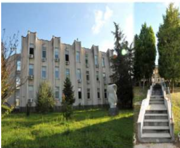
Zgrada u kojoj je smesteno sedište suda

ZAMENIK PRESEDIKA SUDA: sudija Zorica Stanišić (tel.034/723-908)