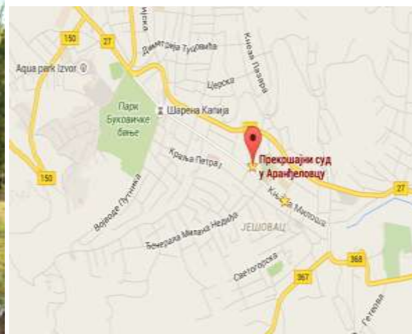
Mapa lokacije sedišta suda