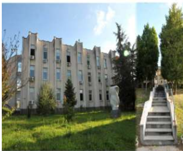
Зграда у којој је смештено седиште суда