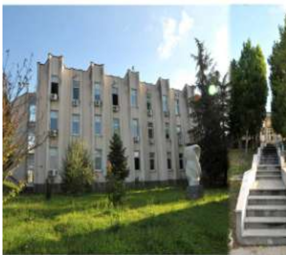
Зграда у којој је смештено седиште суда