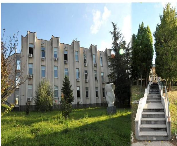
Зграда у којој је смештено седиште суда