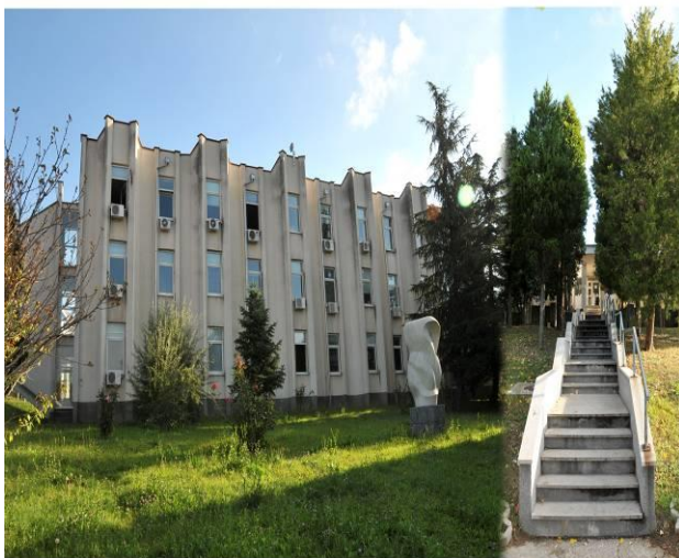
Зграда у којој је смештено седиште суда